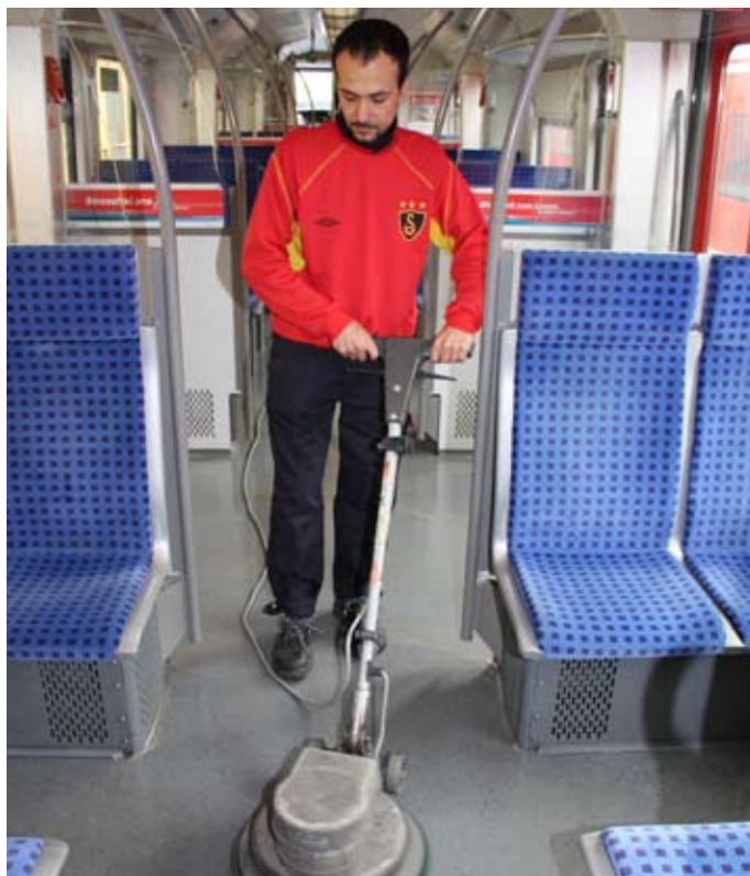
Saubermann: Nachdem das Reinigungsmittel eingezogen ist, befreit ein Service-Mitarbeiter mithilfe der Reinigungsmaschine den Boden vom groben Schmutz.

Gibt es beispielsweise Fahrplanänderungen oder Bauvorhaben, müssen die Arbeitsaufträge für die Mitarbeiter diesen veränderten Bedingungen angepasst werden. Kommt es wegen einer Betriebsstörung einmal vor, dass ein Zug ausnahmsweise nicht gereinigt wird, fällt das