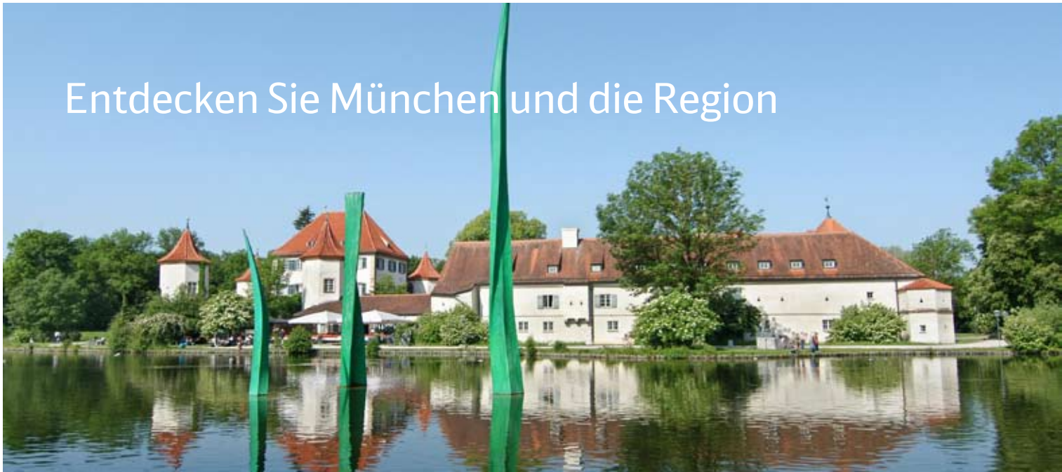
Das Schloss Blutenburg: Das Anwesen liegt im Ortsteil Obermenzing. Die Würm und viele alte Bäume trennen die Anlage von der Geräuschkulisse der Umgebung ab.