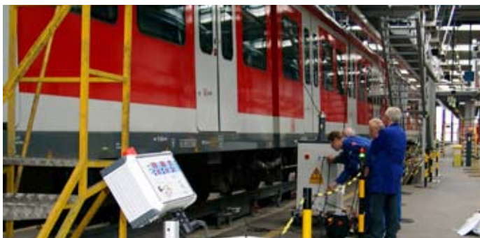
Im Betriebshof: Facharbeiter überprüfen die „Hochspannung“ nach dem Einbau neuer Messwandler, welche für die Energieverbrauchsmessung eingebaut sind.