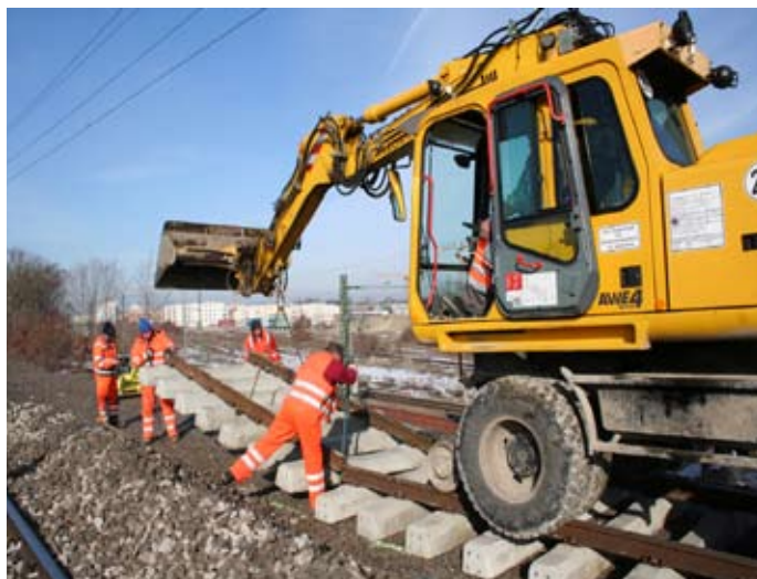
Bauarbeiten: Die Modernisierung des S-Bahnnetzes läuft 2009 auf Hochtouren.