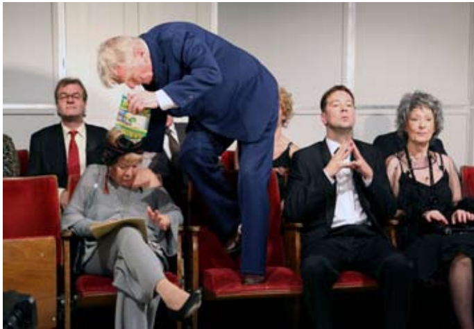
Der Konzertbesuch: Lachen über normale Alltagserfahrungen.